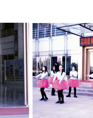
志鸿教育集团第一届“同心协力”拔河比赛