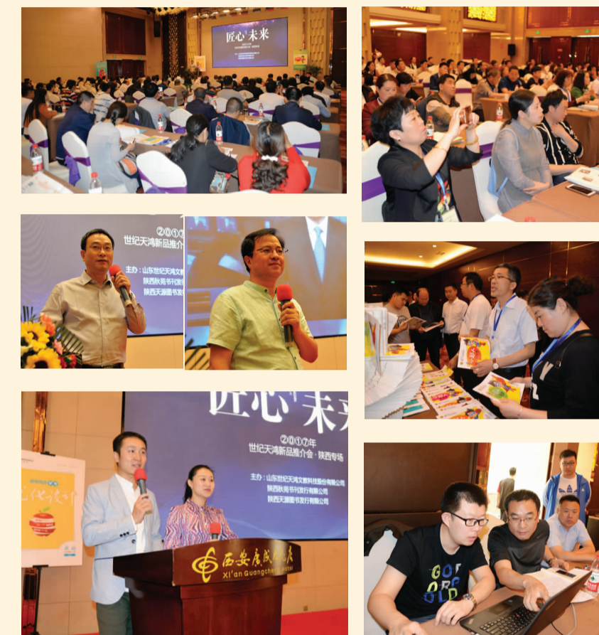
2017年5月8日 陕西专场·西安