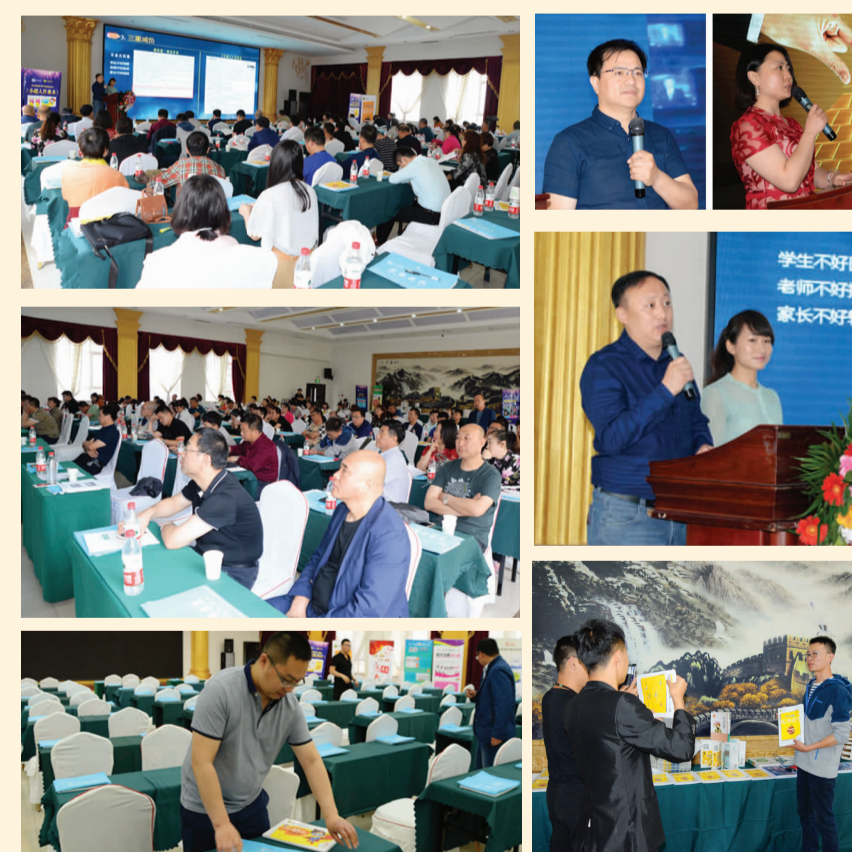
2017年5月14日 辽宁专场·沈阳