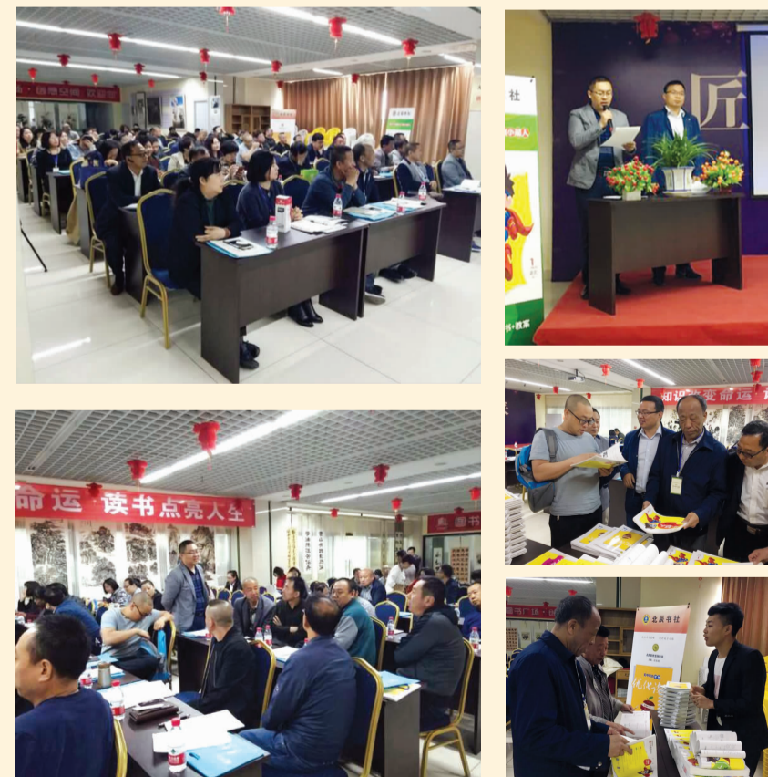
2017年5月11日 山西专场·大同