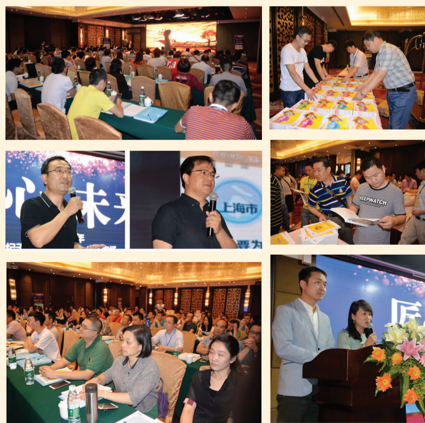
2017年5月10日 广东专场·广州