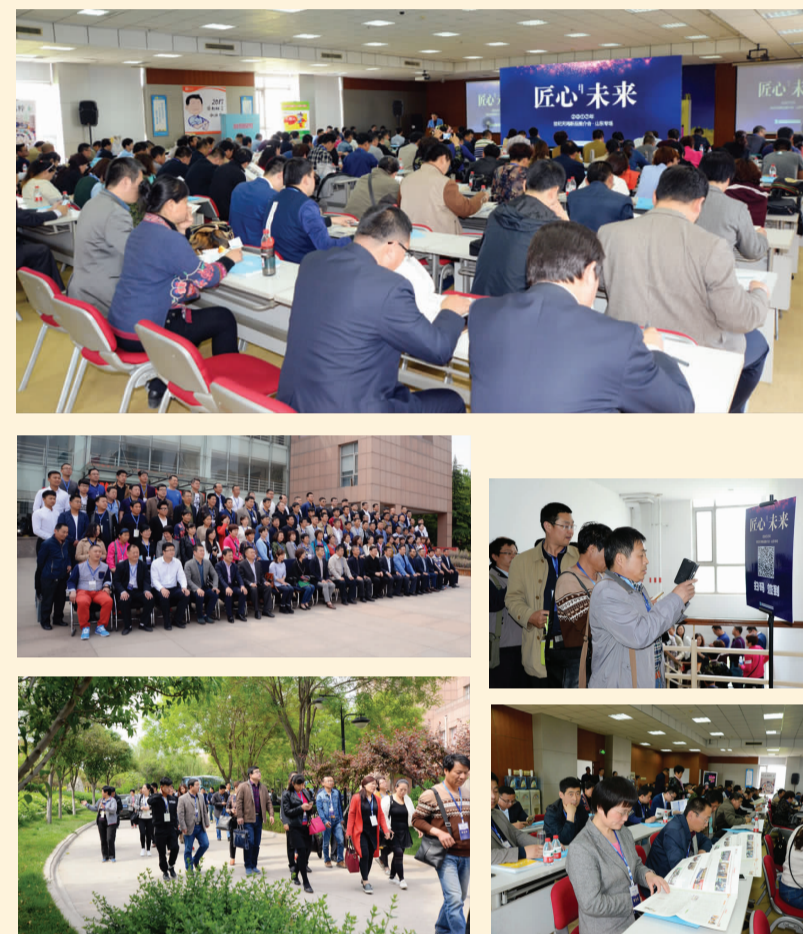
2017年4月26日 山东专场·淄博