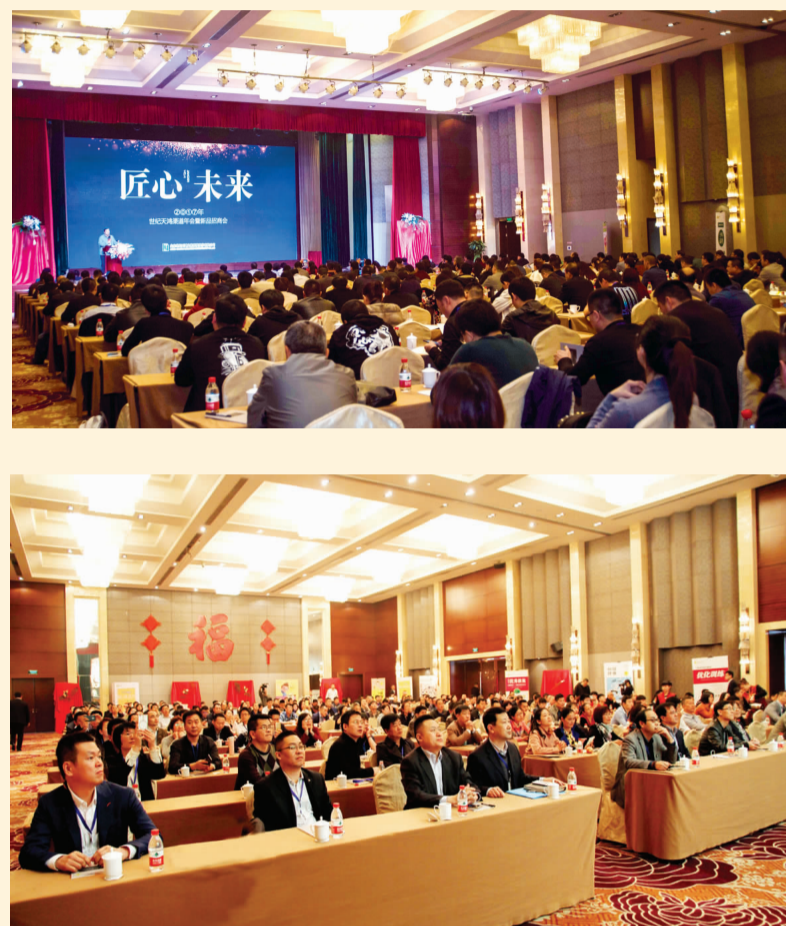
2017年4月7-9日 “匠心·未来”——世纪天鸿渠道年会暨新品招商会