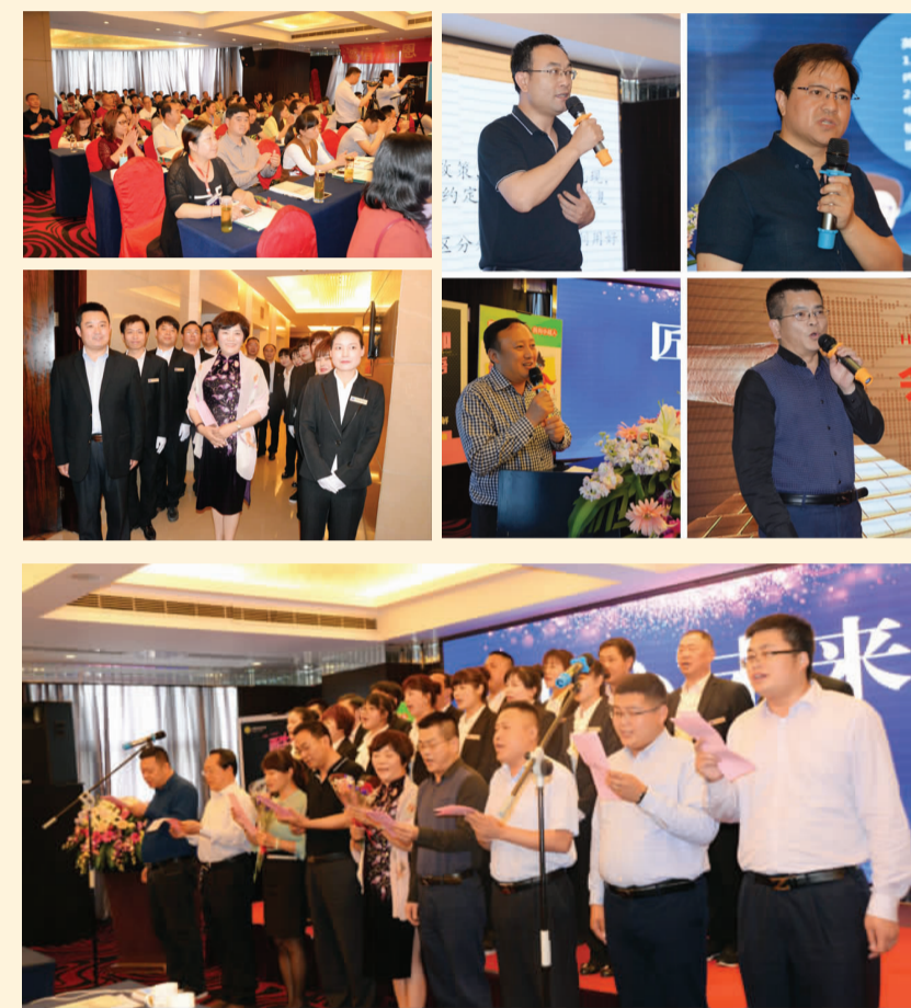
2017年5月5日 安徽专场·合肥