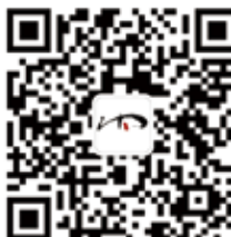
微信扫一扫，敬请关注 志鸿教育公众号