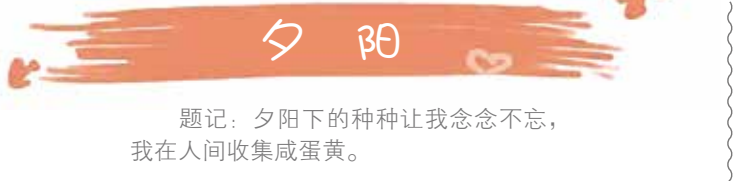
题记：夕陽下的种种让我念念不忘，我在人间收集成蛋黃。

书里总爱写喜出望外的傍晚，年轻的小夫妻下班后结伴去市场，情节老套却浪漫至极。夕陽下脸庞青涩的学生在路口等回家的红绿灯，恍然间，青春早已换了一代人。